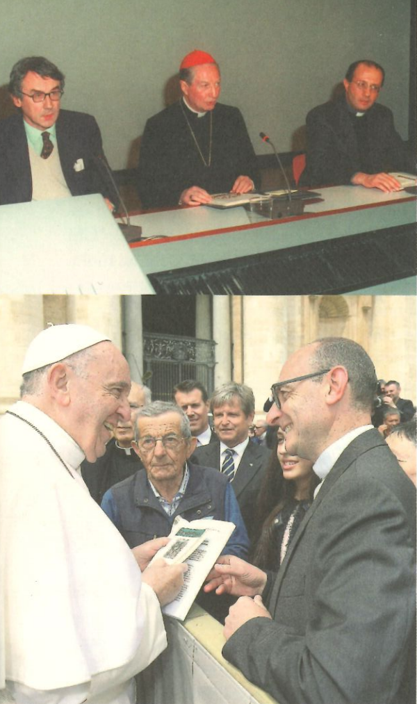
FONDAZIONE CARLO MARIMARTINI.IT